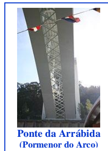
Ponte da Arrábida (Pormenor do Arco)

Formou-se em Engenharia Civil pela Universidade do Porto, foi docente universitário durante algumas décadas e entre outros graus académicos foi agraciado com o Doutoramento Honoris Causa pela Universidade do Rio de Janeiro.