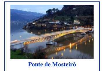
Ponte de Mosteirô